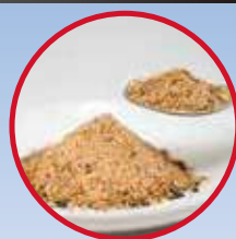
オリジナル スパイス