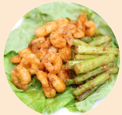
チャレヨでサッと炒めるだけ!! 海老とアスパラのピリ辛炒め

原材料名：砂糖・異性化液糖、にんにく、食塩、唐辛子、醸造酢、発酵調味料、コーンスターチ、かつおぶしエキス、パプリカ、乳糖、鶏・豚エキス、調味料（アミノ酸等）、酸味料 （原材料の一部に小麦・乳・大豆・鶏肉・豚肉を含む）