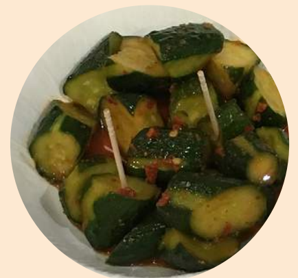
漬け込んだだけ!! 簡単きゅうりキムチ