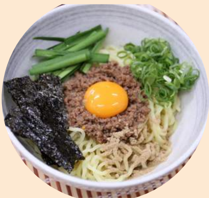
挽き肉をチャレヨで味付け!! 台湾まぜそば